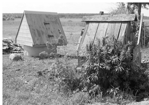
метрах в трехстах от их домов расположен свинарник сельхозпредприятия «ДиК», который отапливается газом.